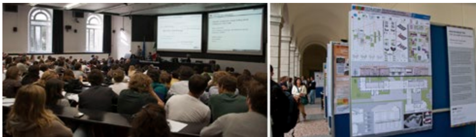
Sopra: Fig. 5. La mappa delle azioni e realizzazioni di Cscs nel 2012. A lato: Fig. 6. Iniziative divulgative del progetto Cscs. A sinistra, la Giornata della sostenibilità 2013; a destra, la mostra delle Tesi di laurea.

A queste azioni concrete e diffuse si aggiungono diverse attività di collaborazione con gli attori pubblici, in particolare con il Consiglio di zona. L'attività di punta ha riguardato una serie d'iniziative in piazza Leonardo da Vinci, porta del campus e luogo privilegiato d'incontro tra città e università. Dopo un processo collaborativo con la comunità locale ed una serie di passaggi burocratici e politici, il Consiglio di zona con il supporto di Cscs è riuscito a pedonalizzare la piazza e rimuovere circa 200 parcheggi auto. Partita come iniziativa provvisoria, la pedonalizzazione è stata confermata nell'autunno del 2013 ed è ora in fase di studio un progetto di dettaglio per la riqualificazione delle pavimentazioni e delle aree verdi. A sostegno dell'iniziativa non è stato sufficiente soltanto chiudere al traffico veicolare lo spazio, ma si è inteso accompagnare la trasformazione con un palinsesto di eventi e iniziative sportive e culturali che hanno visto coinvolta la comunità e i diversi attori locali al fine di riconquistare lo spazio (progetti MiMuovo e RiconquistaMi). 10