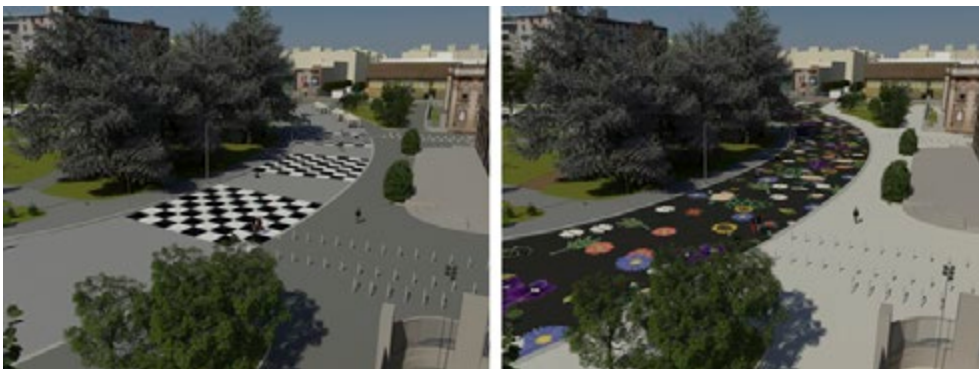
Fig. 1. Uno strumento per la condivisione e comunicazione delle simulazioni di progetto e la valutazione degli scenari alternativi. Due simulazioni interattive e dinamiche per la riqualificazione di piazza Leonardo da Vinci.

È necessario puntualizzare che quella proposta non è tanto una trasformazione fisica dei luoghi, quanto una serie di azioni (talvolta piccole e diffuse) che mirano al cambiamento degli stili di vita degli abitanti, favorendo pratiche più sostenibili, a partire dalla mobilità, la nutrizione e il benessere della persona in generale. Ci troviamo in un contesto territoriale ideale per attivare un processo complesso e partecipato, in quanto si tratta di un luogo consolidato nella sua dimensione fisica (già ampiamente costruito), abitativa (densamente popolato) e funzionale (dotato infatti di una varietà di destinazioni d'uso). Ciò favorisce un più agile processo di coinvolgimento della popolazione residente, poiché le operazioni di envisioning di scenari futuri possono appoggiarsi a una realtà ben conosciuta e non a una tabula rasa (MORELLO ET AL. 2013). In tal modo è più semplice e immediato comunicare la trasformazione, attraverso studi comparativi basati sul 'prima e dopo' l'intervento proposto (fig. 1).