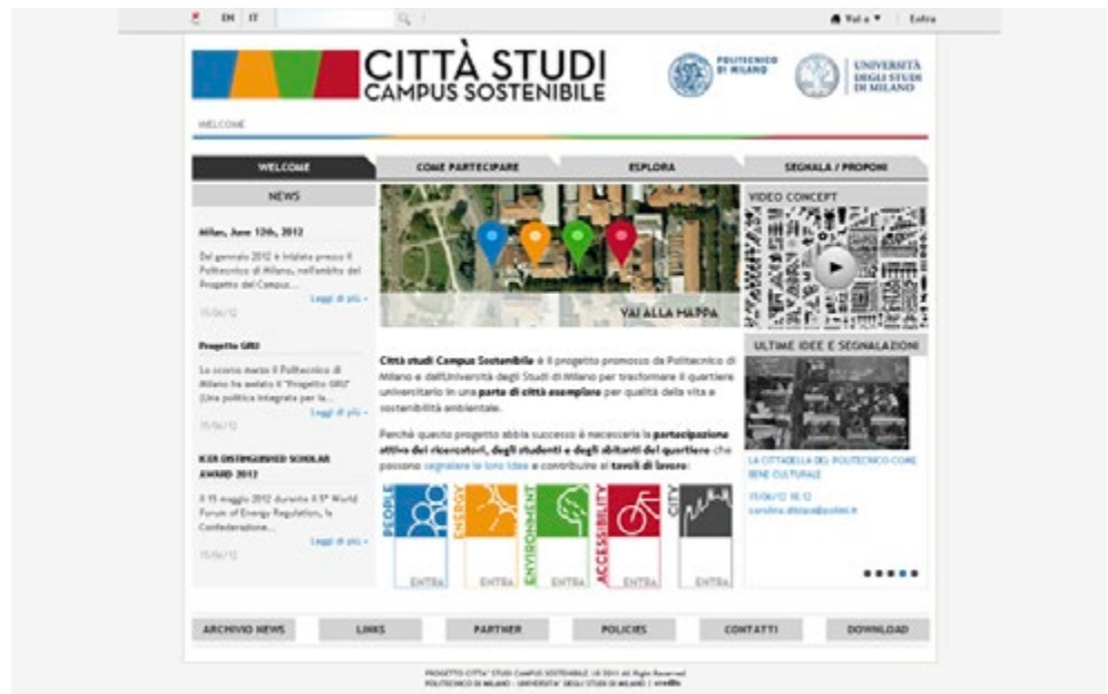
Fig. 4. La homepage della piattaforma di Cscs. Sul sito è possibile caricare proposte e progetti e segnalare fatti e osservazioni.

ambiente (tavolo environment ), energia (tavolo energy ), socialità (tavolo people ) e accessibilità e mobilità (tavolo accessibility ); a questi, si è aggiunto un tavolo di coinvolgimento dei cittadini (tavolo city ) e dal 2014 è stato attivato il tema nutrizione e salute (tavolo food and health ); iii) parallelamente sono state predisposte le basi cartografiche ed il modello urbano digitale sul quale calare le azioni e simulare le trasformazioni; iv) altro fondamentale passaggio è stato impostare la misurazione della sostenibilità: a oggi facciamo riferimento al metodo predisposto dal charter report di IScN, incrociando i tre principi promossi dal network con i temi di Cscs; 7 iv) l'istituzione di strutture di governance amministrativa all'interno degli atenei con personale tecnico dedicato ai temi della sostenibilità e che si farà carico di portare avanti i temi ambientali in maniera permanente. 8