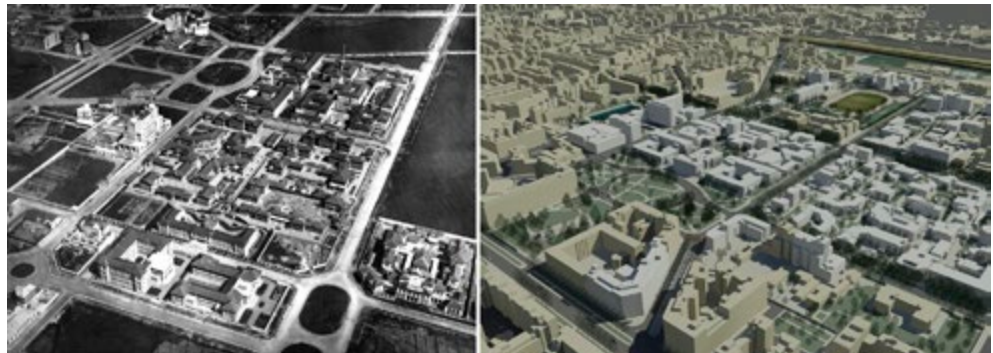
Fig. 2. A sinistra, una foto storica di Città studi; a destra, il modello urbano realizzato per CSCS.