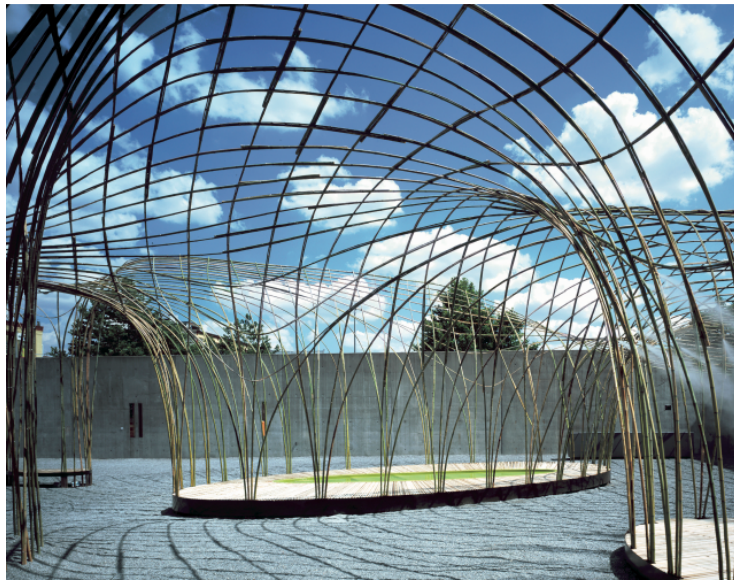
Canopy , copertura in bambù realizzata nella corte del MoMA PS1, New York, 2004.