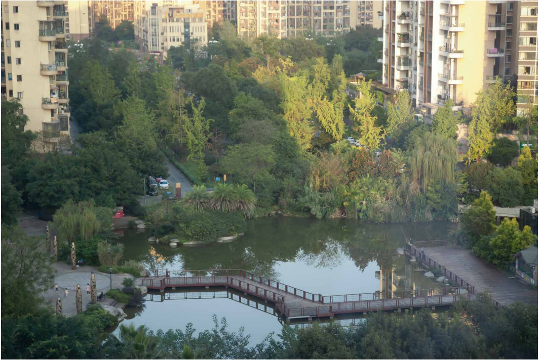
Fig. 8 - Insediamento residenziale e per servizi, Xindu District, Chengdu, Cina.

giungere a questo che per tutti i progetti di paesaggio si impone oggi una verifica di sostenibilità proprio rispetto ai regimi idrici, sia in relazione alla richiesta specifica di consumo della risorsa, che per le capacità del sistema di reagire ai flussi, in regime ordinario quanto in eventi eccezionali.