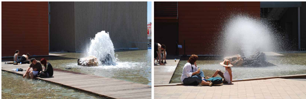
Figg. 4-5 - Expo dell'Acqua di Saragozza, 2008.

ne urbane e la creazione nelle case della sala da bagno, l'acqua "che è sempre stata percepita come l'elemento femminile della natura, nel diciannovesimo secolo [verrà] collegata a una nuova immagine «igienica» della donna" (Illich 1986, p. 14). Quindi così sarebbe caduta in pittura la necessità di giustificare il nudo in termini religiosi: carne e acqua sono rappresentate come parti di natura, e il nudo femminile è reso innocuo. Continua Illich, a partire da Acqua e sogni di G. Bachelard, sul rapporto tra "spazio urbano e l'acqua di città", focalizzando le modalità con le quali una società dà una figurazione alle "sostanze a cui l'immaginazione dà forma" e che "sono esse stesse [...] delle creazioni sociali". Quella di Illich "è l'acqua di cui si ha bisogno per sognare la città come un posto abitabile" (Illich 1986, p. 22).