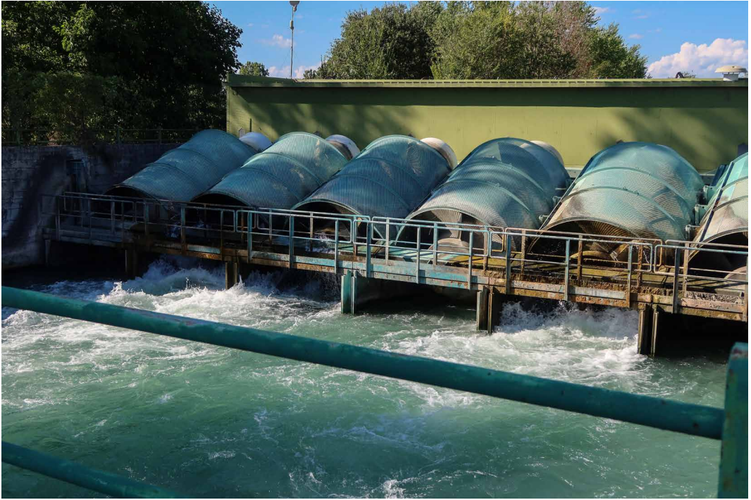
Fig. 10 - Nodo idraulico di Marengo.

me il progetto di paesaggio possa rappresentare uno strumento relazionale capace di favorire l'emergere di un processo di progressiva responsabilizzazione nei confronti del ruolo dell'acqua e del valore da riconoscere ai luoghi storicamente appartenuti all'acqua. Il progetto può fare in modo che questi ultimi, da ambiti residuali e marginali, divengano spazi capaci di interpretare le differenti, e cicliche, fasi evolutive della natura. L'obiettivo diviene quello di creare nuovi scenari d'uso che, tenendo conto dei fattori ecologici e sociali, definiscano strategie capaci di trasformare la complessità del sistema idrografico in un insieme di luoghi dove socialità e dinamiche ecologiche interagiscono dando vita a nuove forme di urbanità.