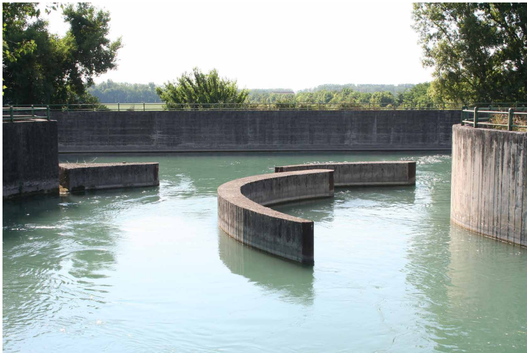
Fig. 9 - Nodo idraulico di Marengo..

stione delle acque vista come opportunità di ripensare ad un rapporto con il bacino di riferimento dei corsi d'acqua, gestione che diventa occasione di innovazione nella complessa e multiforme realtà che chiamiamo paesaggio. In questa visione assume un risalto particolare il ruolo svolto dall'acqua, sia quale componente fondamentale di natura sia per come si intreccia alla storia della società umana, nelle più diverse situazioni e nei più diversi contesti.