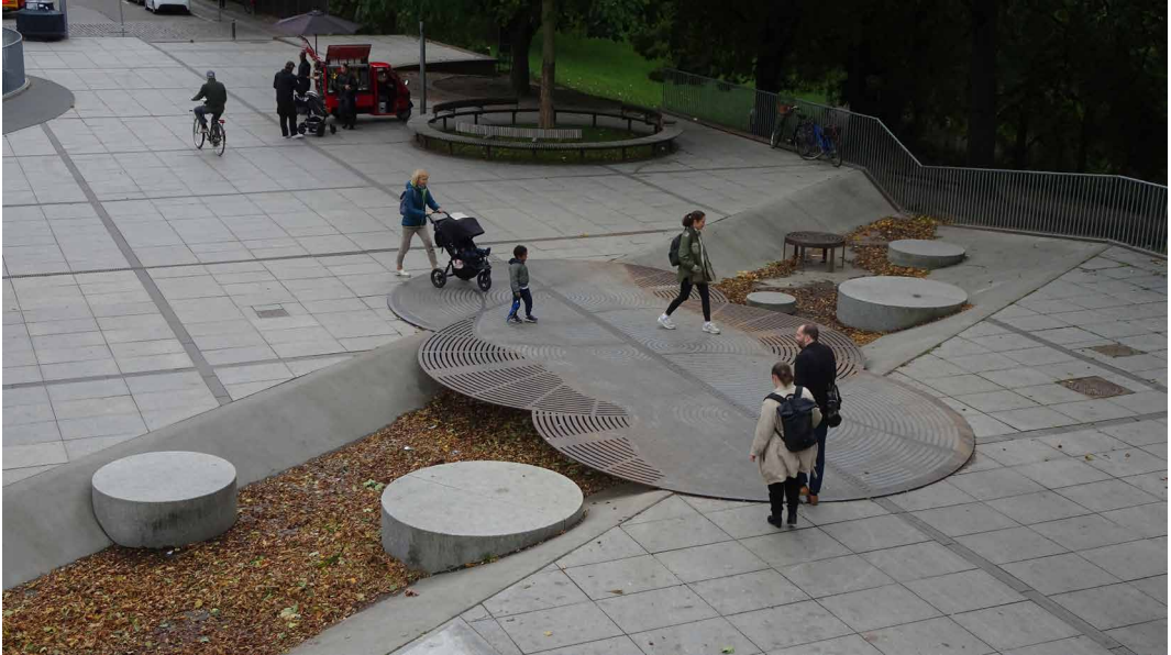
Fig. 13 - Israels Plads, Copenhagen, COBE.

favorisce un atteggiamento progettuale che risulta orientato a rivedere approcci tradizionali che riguardano gli spazi di divagazione delle acque, ancora troppo spesso caratterizzati dalla dicotomia esistente tra volontà di accrescimento dei valori propri dell'ambiente naturale e necessità di governo degli insediamenti umani.