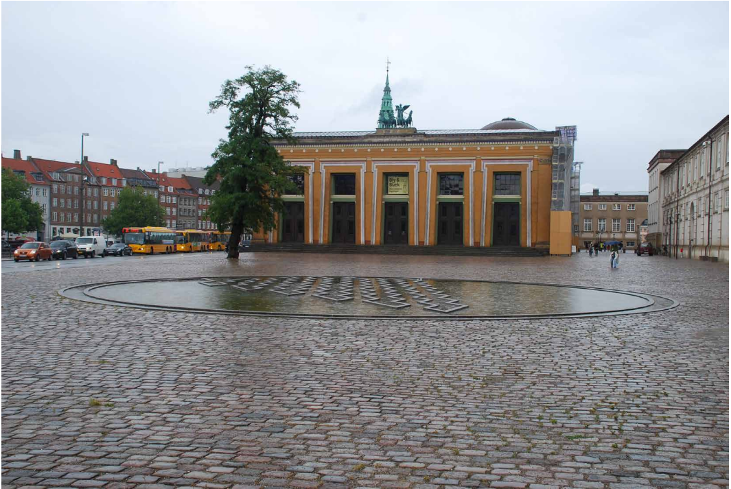
Fig. 7 - Fontana per la piazza del Museo Thorvaldsen, Copenaghen. Jørn Larsen, 2005.