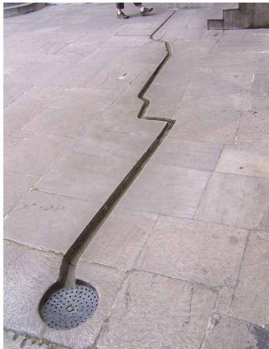
Figg.1 - 2 - Cortili del Palazzo di Topkapi, Istanbul.

che propongono letture articolate a partire dal riconoscimento del legame imprescindibile che l'acqua stabilisce con i territori che attraversa; un attraversamento che definisce un insieme di corrispondenze profonde, di forte significato per il paesaggio, capaci di definire una struttura relazionale profonda.