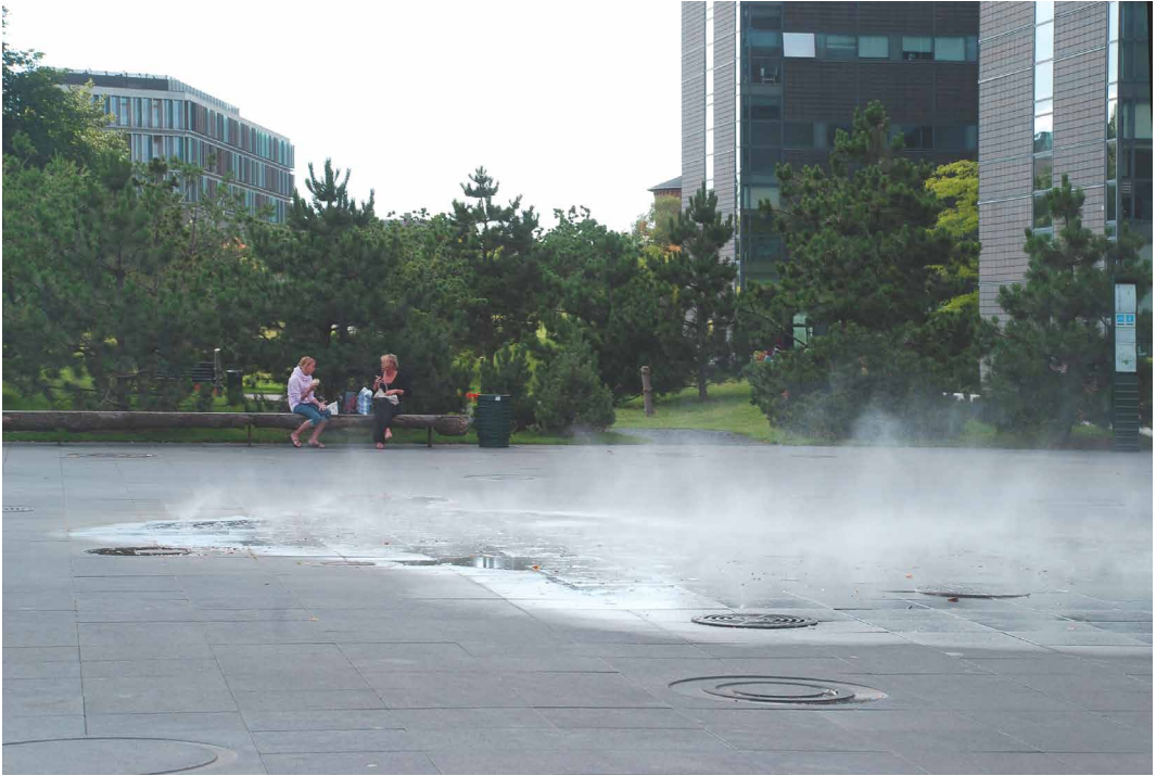
Fig. 3 - Spazi urbani Frederiksberg, Copenhagen. SLA / Stig L. Andersson.

menti climatici. In entrambi i casi determinano una scarsa disponibilità diretta, spesso drammatica, comune in molte parti del mondo, talvolta anche generatrice di conflitti, oggi come nella storia. In altri contesti, per contro, l'eccesso dell'acqua si configura come rischio che determina un'incertezza rispetto alle condizioni dell'abitare. La considerazione per tali mancanze e/o eccessi può giustamente travalicare aspetti più elementari e forse apparentemente superficiali, del desiderio connesso alle forme di piacere derivanti dal contatto con l'acqua, e dai relativi e complessi immaginari connessi a queste. Ma probabilmente questi sono tutti appunto diverse sfaccettature di un tema che non può essere descritto e affrontato in una direzione univoca.