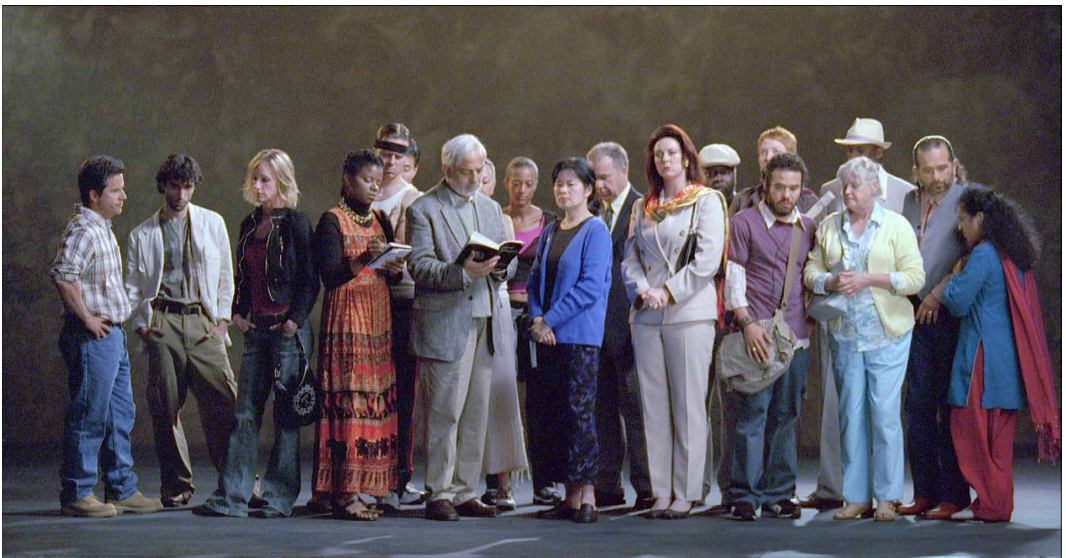
Fig. 6 - Fotogrammi da The Raft , di Bill Viola, 2004.

ca e aiuta per fastidiosi inestetismi, reificato dall'immagine di una giovane, che sostituisce il neonato ma che come lui voltegga nell'acqua. La giovane è nuda, ma come il neonato - e forse come i nudi ottocenteschi secondo Illich - si presenta priva di ogni potenziale erotico esplicito. Da questo, in una società in cui ormai l'immagine del fisico è sempre più invasiva, arrivare al paradosso dell'"acqua che elimina l'acqua", con le infinite testimonial, snelle e atletiche, quasi sempre esplicitamente sexy, il passo è stato breve.