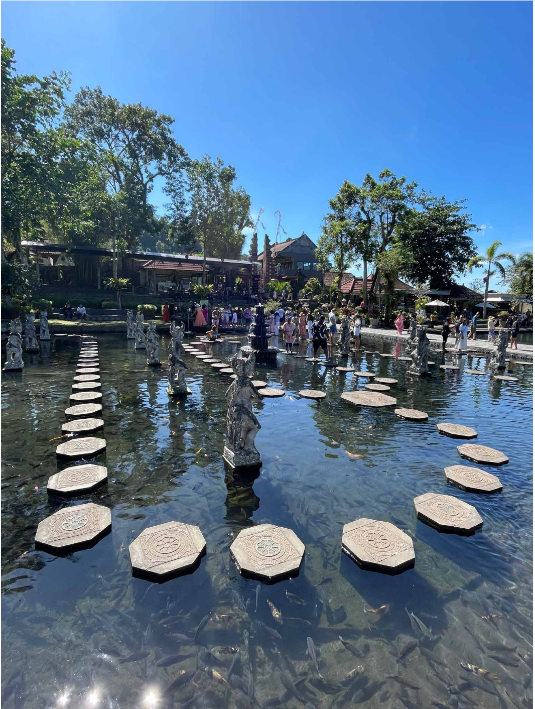
Fig. 14 - Tirta Gangga – Palazzo dell'acqua, Bali, Indonesia.