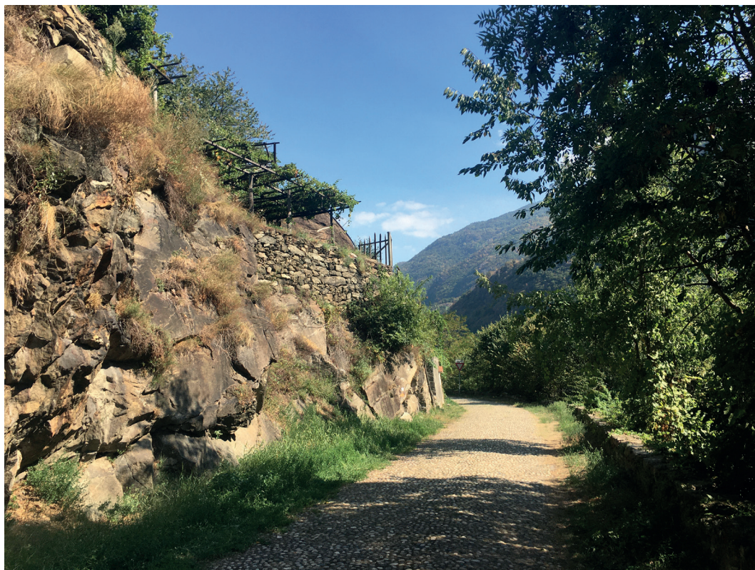
Fig. 6 – Via Francigena tra Verrès e Pont-Saint-Martin (AO).

innervano capillarmente i rilievi, usati dalla comunità locale come dai viandanti per spostarsi di valle in valle. Strade, sentieri e mulattiere hanno contribuito così a rendere fruibili e vivibili le valli concorrendo alla definizione del concetto di Heimat (Salsa, 2019). La rete della viabilità storica, e il cospicuo patrimonio costruito minuto e diffuso che la accompagna, costituiscono testimonianze preziose della storia culturale, sociale ed economica delle comunità che li hanno prodotti imprimendo linearmente sul territorio il segno del loro passaggio. Lungo tale rete si ritrovano non solo insediamenti stabili o temporanei e spazi agricoli, ma anche fontane per l'abbeveramento, simboli religiosi ed altri elementi puntuali collocati a supporto di coloro che percorrevano i sentieri quotidianamente o per spostamenti di lungo raggio.