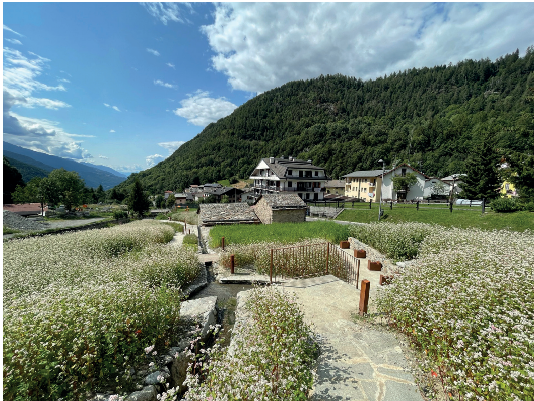
Fig. 3 – Mulino dei Plaz di Aprica (SO).

paesaggistico che ne costituiva la primaria attrattiva e dall'altro trascurando la realizzazione di luoghi e spazi di qualità per chi lo abita.