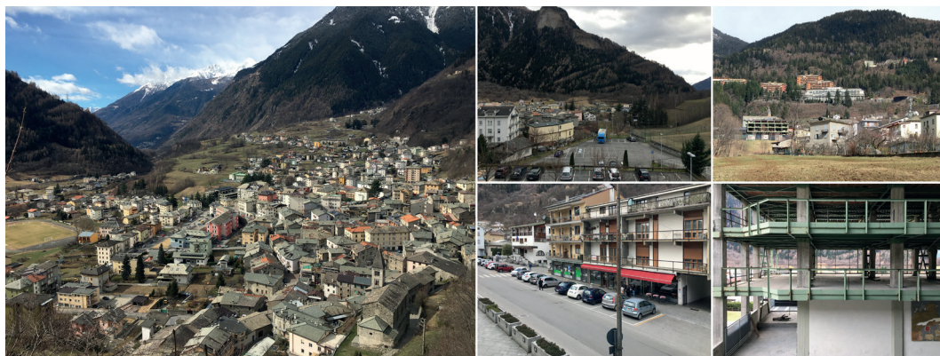
Fig. 2 – Il centro urbano di Sondalo (SO).

Questi spazi possono riconfigurarsi come opportunità per innestare un nuovo sistema di spazi pubblici e collettivi che unisca gli ambiti sconnessi e frammentati del fondovalle con il sistema degli spazi aperti alle diverse quote in un disegno complessivo di luoghi e relazioni che si sostanzia come vero e proprio progetto di paesaggio.