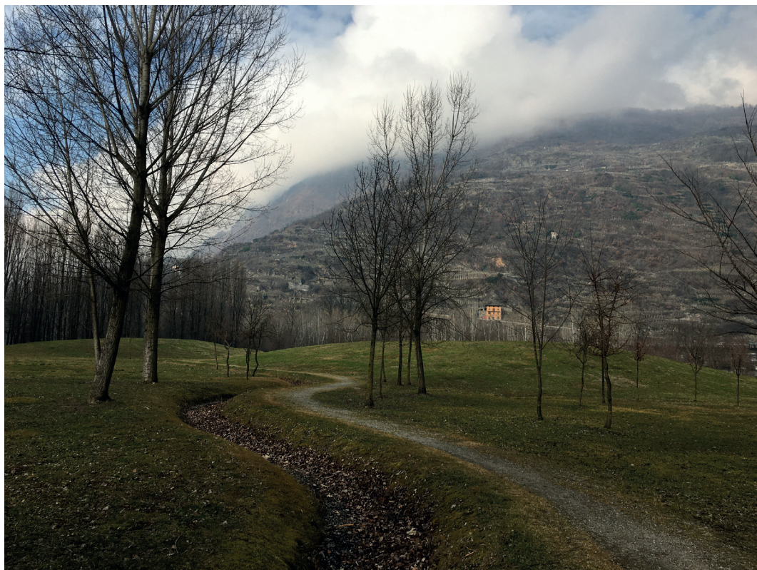
Fig. 4 – Parco Adda-Mallero, Sondrio.

tro che potrebbe costituire una preziosa opportunità di rigenerazione per costruire nuove relazioni spaziali e percettive.