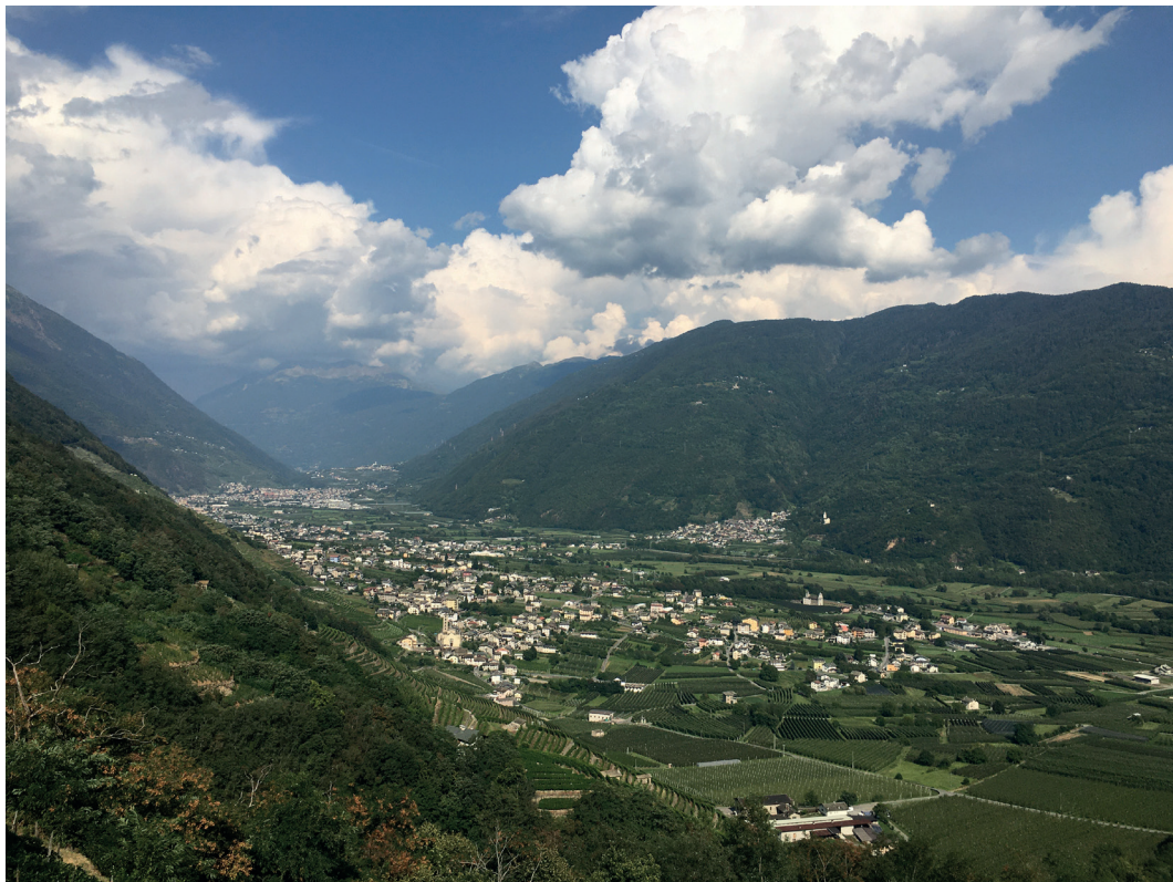
Fig. 1 – Il fondovalle della Valtellina da Teglio a Tirano (SO).

sa quindi attraverso istanze collettive dal carattere fisico e immateriale.