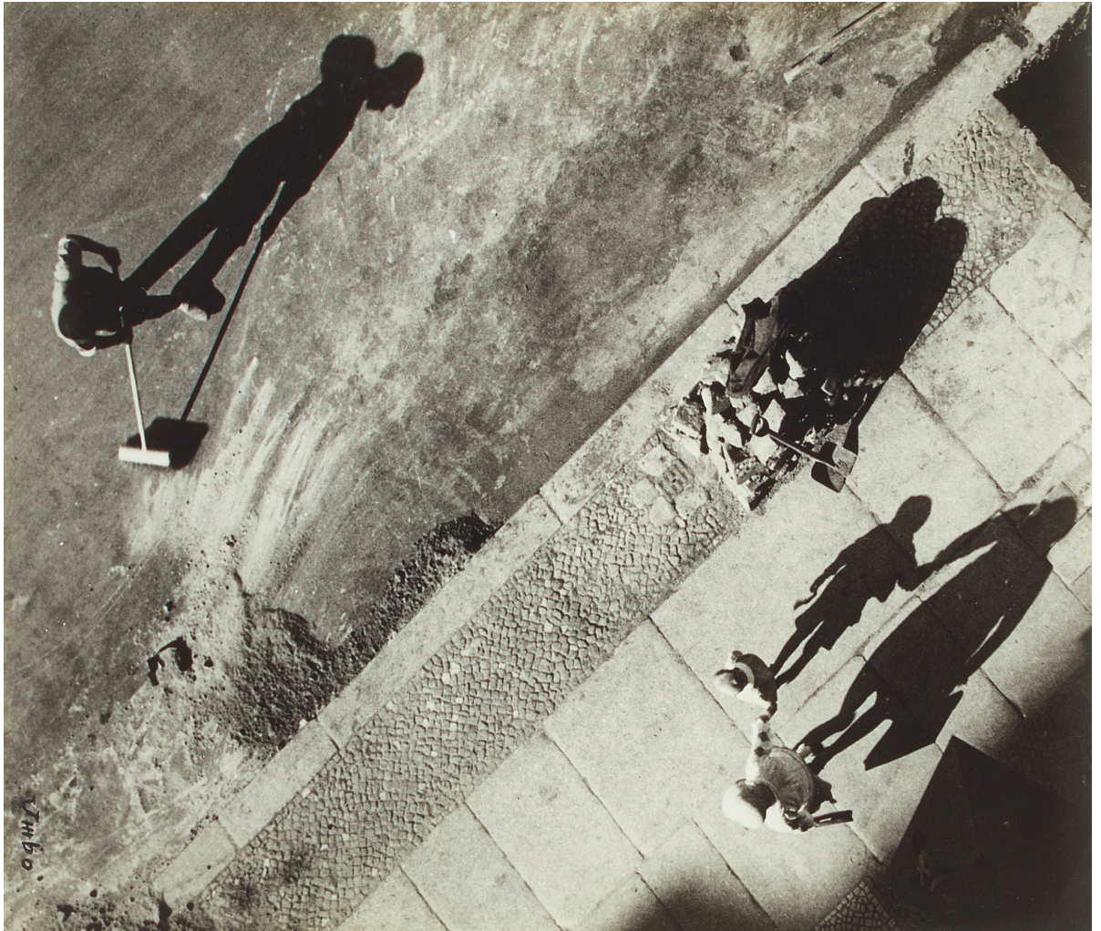
Otto Umbehr (Umbo), El misterio de la calle / The mystery of the street , 1928. Fuente / Source: Wikimedia Commons.

the difficulty of establishing boundaries for cities, it is worth adding that, nowadays, contemporary cities are not only defined by their centres—as is traditionally the case—but also, and especially, for what happens in their boundaries.