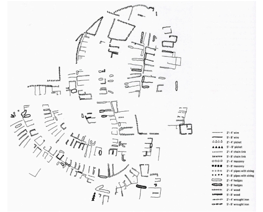
Capitán Francisco Miranda, La ciudad de Caragoça , 1592.; Nicolaas Cruquius, De Rivier de Merwede , ca. 1730.; Michel Desvigne Paysagiste, Issoudun District , 2005. ; Denis Wood, Fences ..

A las sugerentes consideraciones de Perec sobre la dificultad de establecer los límites de la ciudad podríamos añadir que, hoy en día, la ciudad contemporánea no sólo se define por su centro, como ha ocurrido tradicionalmente, sino también, y muy especialmente, por lo que ocurre en sus límites.