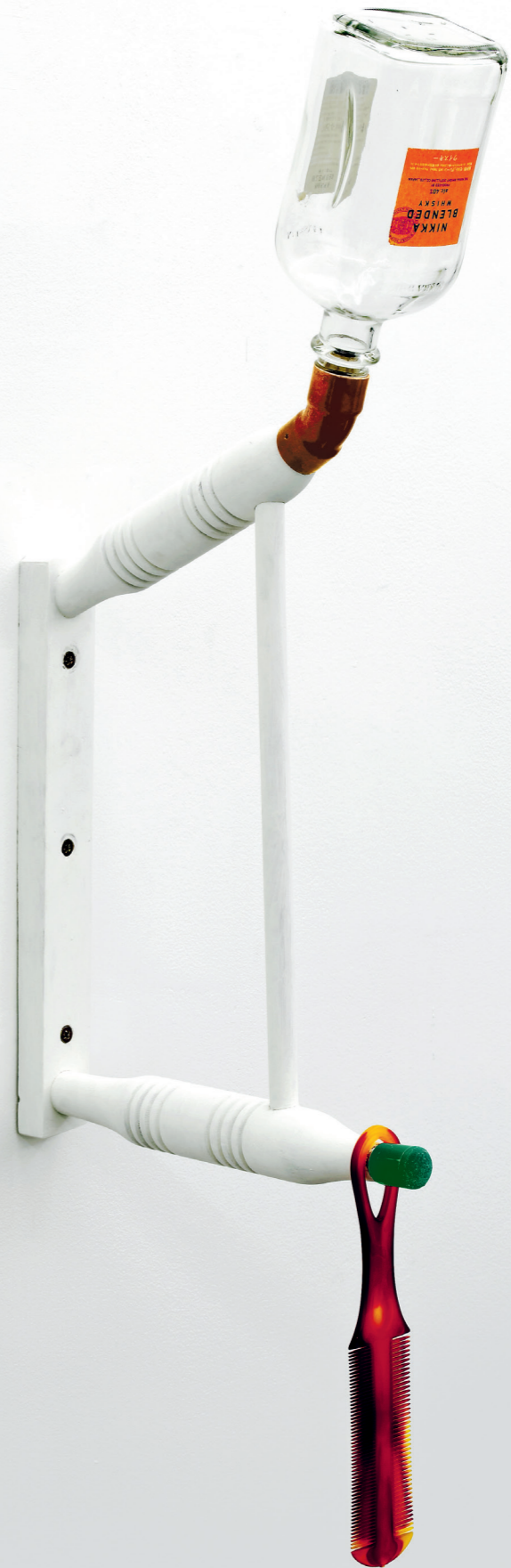
CATACHRESIS #64 Neck of the bottle, elbow of the pipe, legs of the chair and teeth of the comb 2016