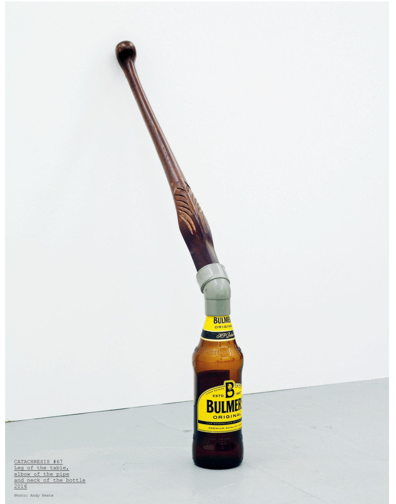
CATACHRESIS #67 Leg of the table, elbow of the pipe and neck of the bottle 2016