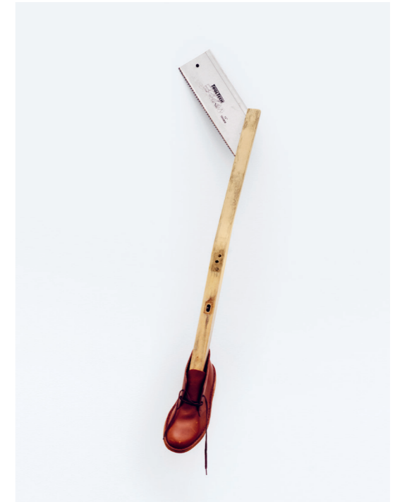
CATACHRESIS #34 Tongue of the shoe, leg of the chair, teeth of the saw, head of the shoe 2013