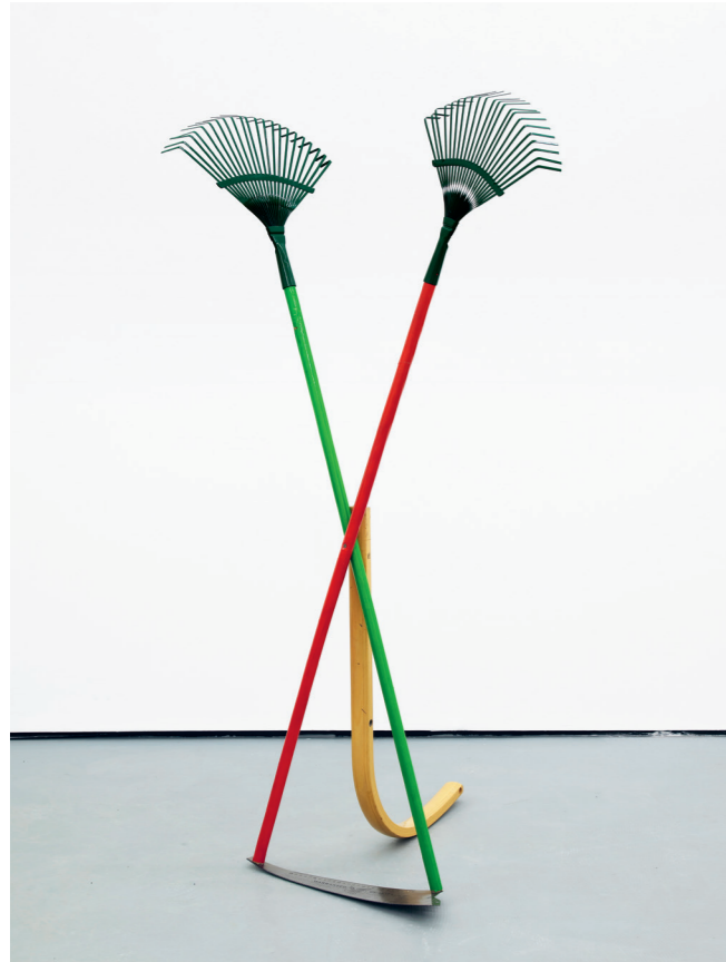
CATACHRESIS #62 Teeth of the rakes, arm of the chair, teeth of the saw and eye of the needle 2016