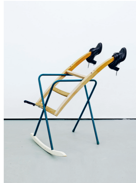
CATACHRESIS #63 Tongues of the shoes, legs of the chair, legs of the table, teeth of the fork and arm of the chair 2016