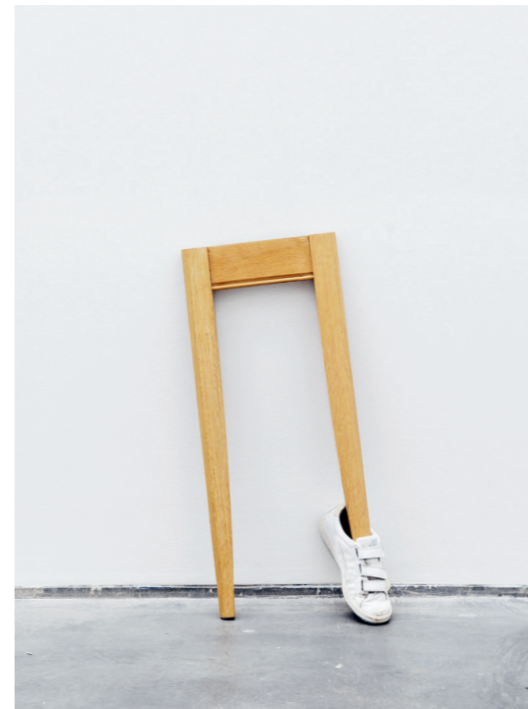
CATACHRESIS #33 Legs of the table, tongue of the shoe 2013