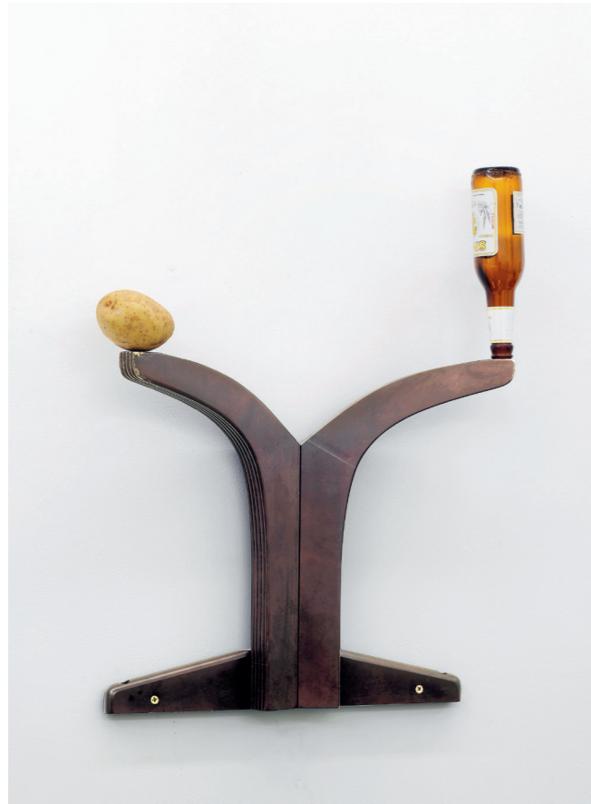
CATACHRESIS #54 Eye of the potato, legs of the table, heads of the screws, neck of the bottle 2016