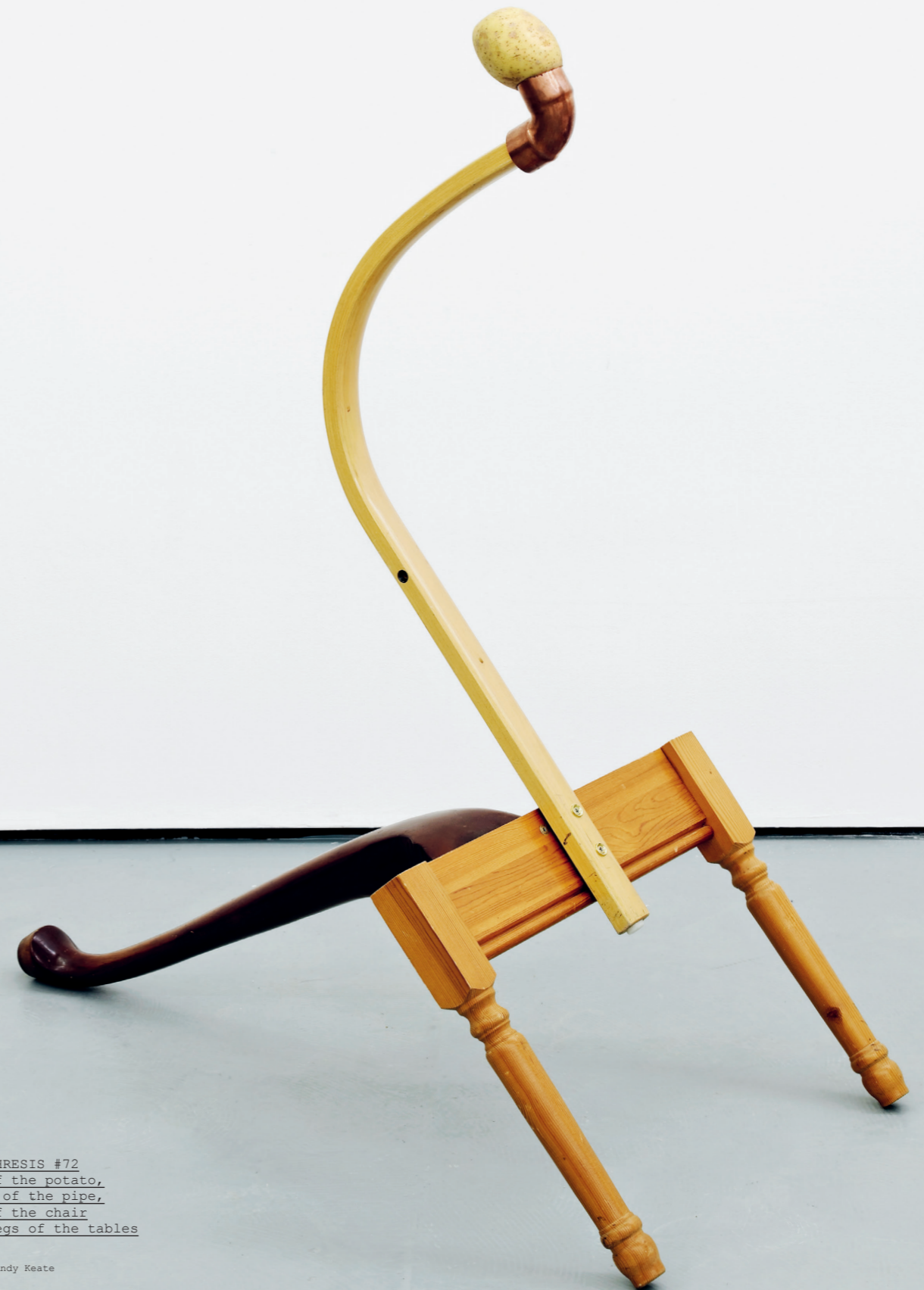
CATACHRESIS #72 Eye of the potato, elbow of the pipe, arm of the chair and legs of the tables 2016

La pubblicazione delle immagini è stata resa possibile dalla collaborazione con la galleria Herald St, London. Publication of the images has been made possible by collaboration with Herald St, London.