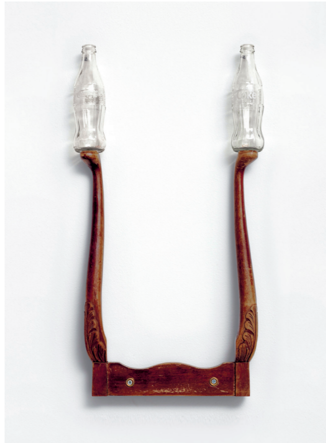
CATACHRESIS #18 Legs of the table, neck of the bottle, head of the screw 2012