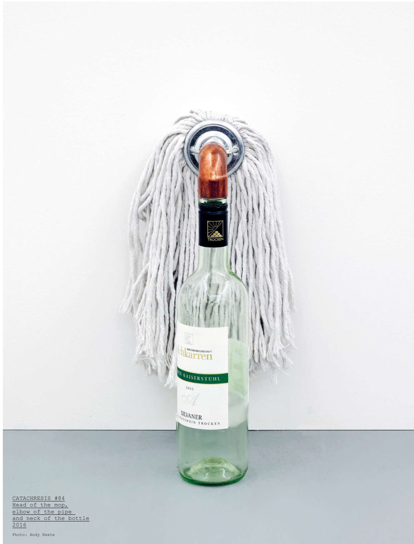
CATACHRESIS #84 Head of the mop, elbow of the pipe and neck of the bottle 2016