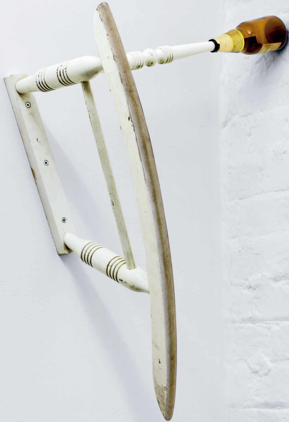
CATACHRESIS #10 Leg of the chair, neck of the bottle 2011