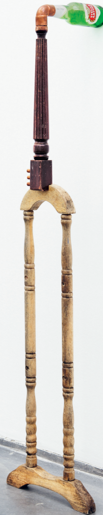
CATACHRESIS #9 Legs of the table, the neck of the bottle, the elbow of the pipe, the leg of the chair 2011