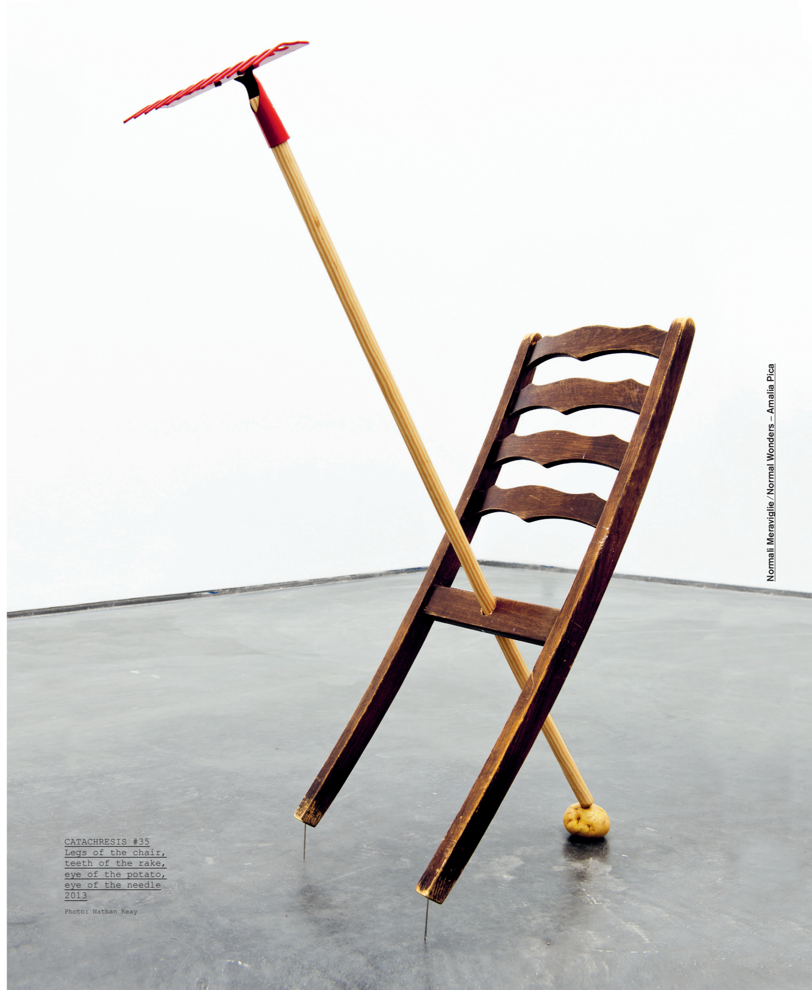
CATACHRESIS #35 Legs of the chair, teeth of the rake, eye of the potato, eye of the needle 2013