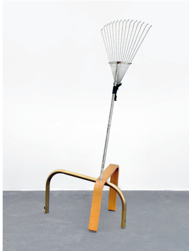
CATACHRESIS #40 Teeth of the rake, leg of the chair, leg of the table, head of the screw 2013