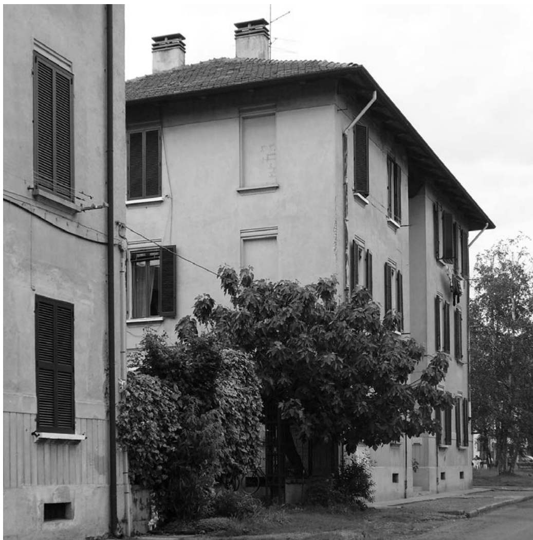
Fototeca ISAL, Fotografia di Virna Elisa Nicoli 2007 Villaggio SNIA Periferia di Cesano Maderno - Italia