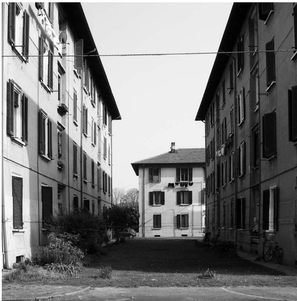
Fototeca ISAL, Fotografia di Virna Elisa Nicoli 2007 Villaggio SNIA Periferia di Cesano Maderno - Italia