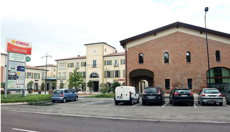
Fig. 4. Casa Corsini e la nuova centralità urbana.