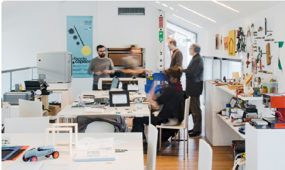
Fig. 5. La prima sede del fablab, all'interno di Spazio Gerra

bottom up di gruppi formati intorno al fablab . Tra di essi, un collettivo di progettisti inaugura nel 2016 Officine Gattaglio, ex capannone convertito in laboratorio per la fabbricazione e localizzato in un quartiere residenziale limitrofo al centro storico.