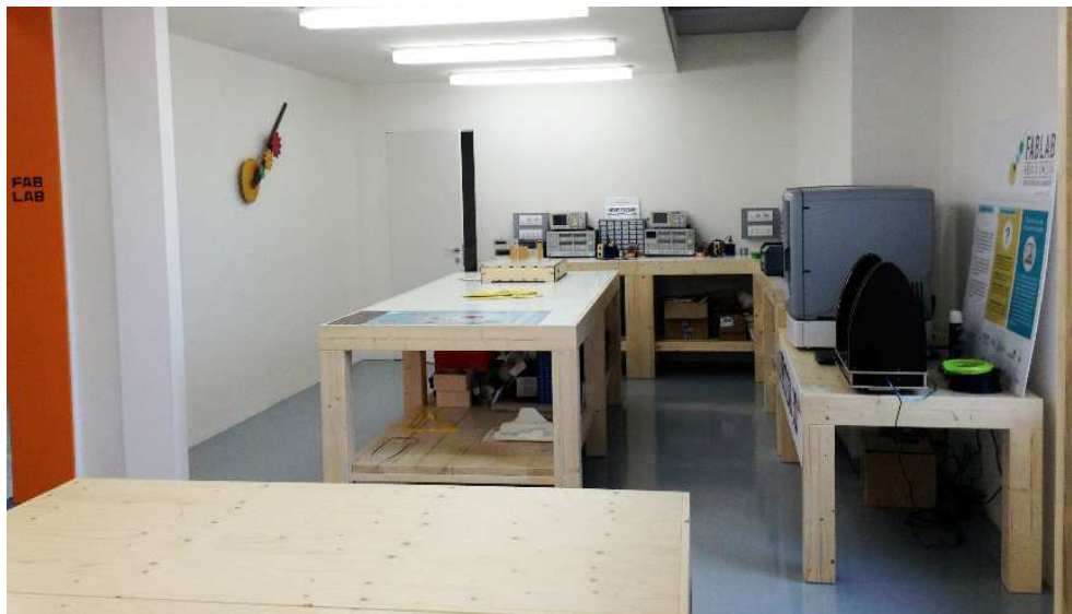
Fig. 6. Lo spazio dedicato al fablab ai Musei Civici.