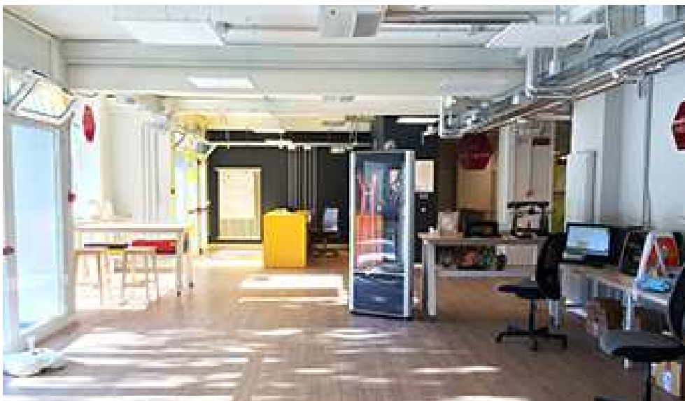
Fig. 2. L'ingresso e lo spazio di lavoro.