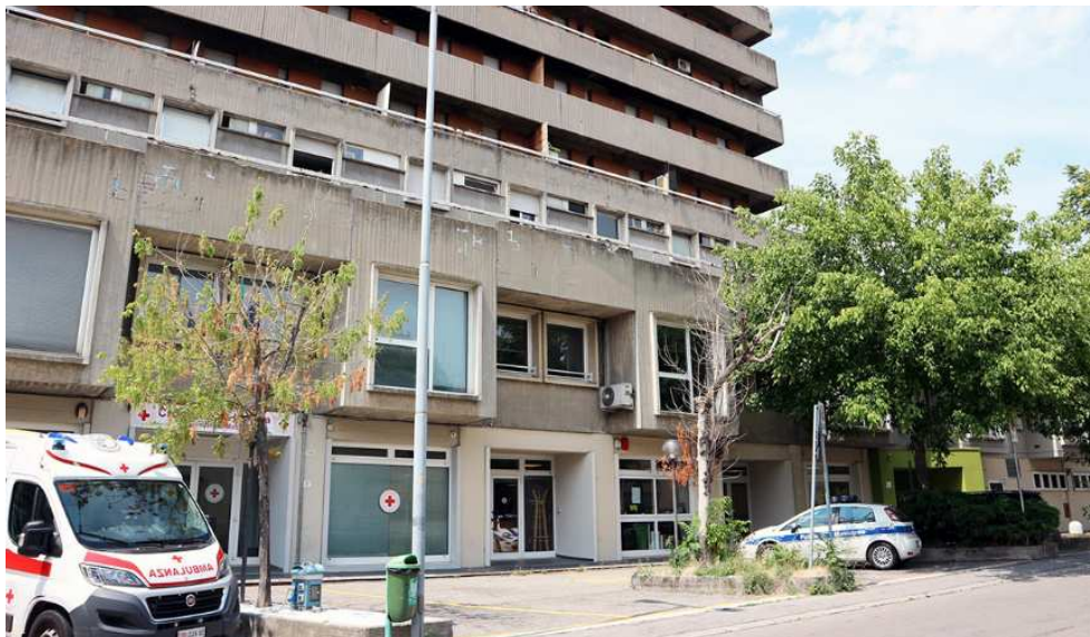
Fig. 1. Le vetrine di Makers Modena, al pianoterra dell'edificio R-Nord (foto dell'autrice).

ed è aperto dal lunedì al venerdì dalle 17 alle 21. L'accesso è soggetto alla registrazione annuale di 20 €, mentre l'uso delle macchine comporta il pagamento del servizio, dei materiali e di un corso introduttivo obbligatorio. Makers Modena fablab ha raccolto in tre anni 400 tesserati e, non disponendo più di sovvenzioni pubbliche, si è recentemente specializzato nella manifattura e nella consulenza B2B.