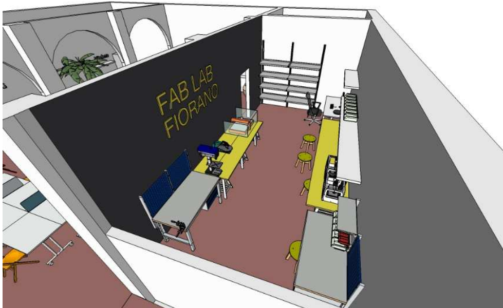
Fig. 3. Il progetto del fablab.

Localizzato a Fiorano Modenese, a 15 km da Modena, è attivo dal 2015. Concepito e finanziato dal pubblico all'interno delle politiche giovanili, questo fablab occupa una piccola stanza al secondo piano di un attrezzato centro civico, realizzato in un'ex casa rurale recuperata. I 600 mq di Casa Factory arricchiscono un'offerta già ricca e articolata di servizi e attività (centro giovanile, sale prova, fonoteca, auditorium). Insieme al coworking , il fablab è inteso come 'politica attiva' del lavoro, nonché come spazio di innovazione sociale e community building . Per questi motivi, intrattiene deboli relazioni con le imprese locali (dei settori ceramico e meccanico-ceramico), mentre si inserisce all'interno di una rete formata da associazioni socio-culturali, scuole e università. Il makerspace promuove lo sviluppo di competenze e la formazione qualificata dei soggetti locali (singoli cittadini, imprese e scuole) attraverso l'offerta di corsi e servizi di consulenza personalizzati, oltre all'organizzazione di eventi e incontri. In questo senso, si tratta di uno spazio realmente "abilitante", che consente alle persone di superare forme di marginalità e cogliere opportunità esistenti, anche attraverso i sistemi di fabbricazione digitale. Intorno al fablab si è creata una comunità di makers (costituitasi in associazione) che oggi gestisce lo spazio, garantendone l'apertura il mercoledì sera (dalle 21 alle 23.30) o su appuntamento.