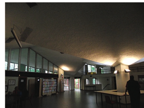
Fig. 3 - School halls whose shapes amplify reverberation.

was part of the research program "Back to School" funded by the Department of Architecture and Urban Studies of the Politecnico di Milano and aimed at updating the framework of users' needs and performance requirements for the renewal of existing school facilities [11]. Data and information were collected both through on-site observations and by involving teachers and students of 38 classes in different ways, according to the model proposed by the OECD in the "International Pilot Study on the evaluation of quality in educational spaces" [12].