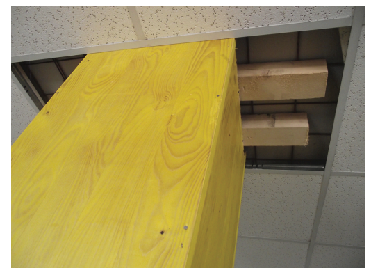
Fig. 1 - Acoustical tiles installed to cover the steel grids.