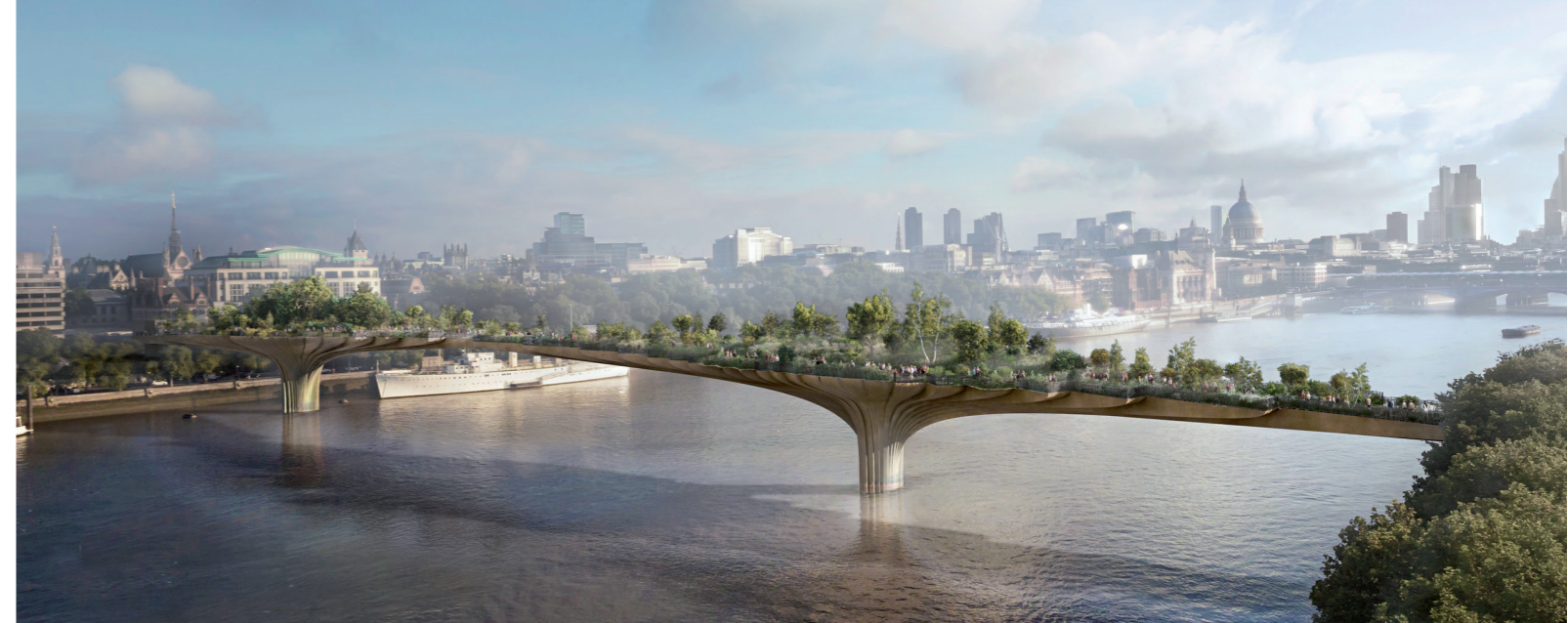
Viste del Garden Bridge.

Questo, per secoli unico punto di collegamento fisico tra le due sponde, dal 1200 fino a metà 1700 era infatti un vero e proprio ponte abitato.