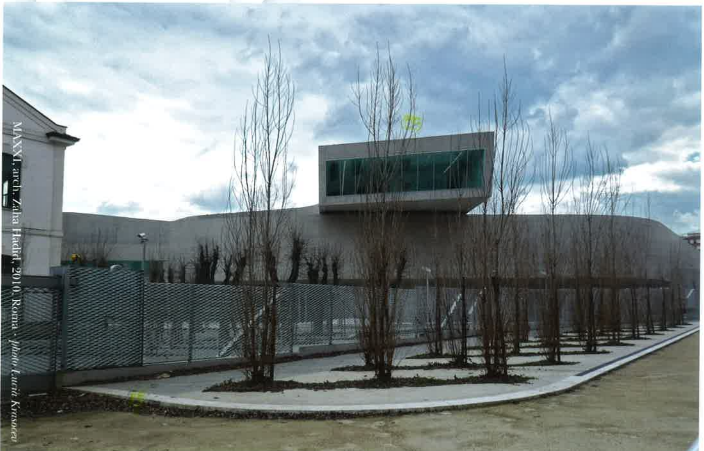
MAXXI, arch. Zaha Hadid, 2010. Roma

Il terzo Convegno Nazionale AIDIA tenutosi a Roma nel 1959, esplorò il tema "La Casa", attraverso una ricerca sul punto di vista della donna professionista che può ideare, con il suo istinto e spirito pratico, una molteplicità di soluzioni innovative per la casa moderna. Il problema della casa venne così trattato non solo dal punto di vista tecnico ma anche dal quello economico-sociale, quale elemento fondante di sviluppo del Paese, per cui i problemi relativi alla casa e l'abitare si dovevano considerare come parte integrante dell'urbanistica, il cui compito era di interpretare e risolvere le esigenze della società nella distribuzione dei nuovi agglomerati urbani ed extraurbani. Nel 1964, a Santa Margherita Ligure si svolse il quarto Convegno AIDIA, a cui parteciparono le consolidate sezioni territoriali di Roma, Torino, Milano e Genova, sul tema "Futuri aspetti dell'edilizia". Quello che emerse dal convegno, era che nell'organizzazione della città futura gli ingegneri e gli architetti dovranno essere non solo i tecnici che "costruiscono" ma anche quelli che organizzano le attività commerciali, economiche e sociali.